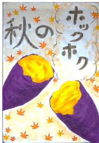
11月の壁画「焼き芋食たいな♪」