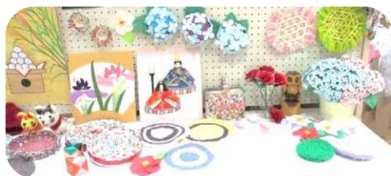
高梁文化交流館において展示