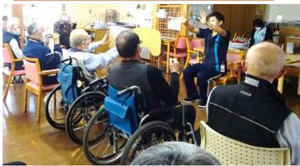
集団でのリハビリ体操