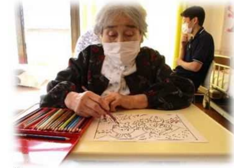
個々の状態に合わせたリハビリメニューに沿って日々頑張っています★★