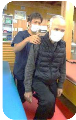
リハビリスタッフによる個別リハビリ